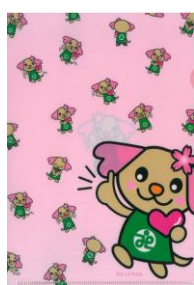
クリアファイル(ピンク)