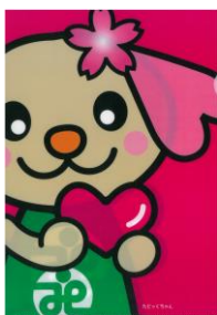
クリアファイル(赤)